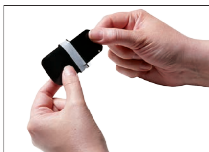
Je to tak jednoduché a flexibilní, jako používat film.

Jasně a ostré intraorální snímky s KaVo Scan eXam™ One věrně reprodukují úroveň šedi a přesně zobrazují požadované diagnostické informace i v těch nejmenších detailech. Jednoduše vložíte zobrazovací destičku.