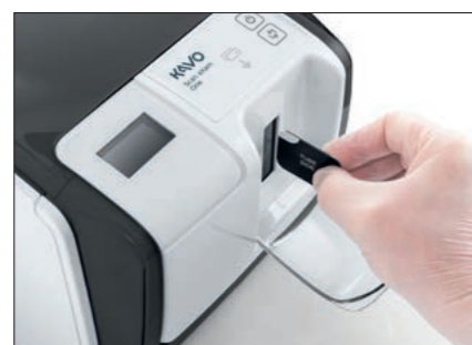
Snadná obsluha zepředu - minimální požadavky na prostor.